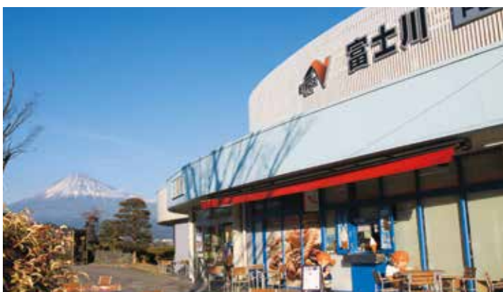
●1968年 東名高速道路においてサービスエリア事業を創業(富士川SA)

1968年東名高速 富士川SAでサービスエリア事業を創業。 その後、東北道、圏央道に拠点を増やし現在7箇所のSA・PAを運営しています。サービスエリア事業を中心として、コンビニ事業やカフェ店舗事業など、食に関わる事業を通じてお客様を笑顔にします。