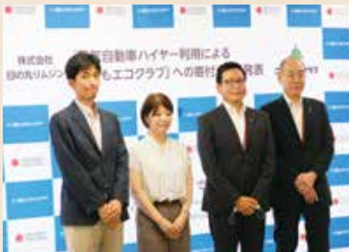
*寄付額：お客様1乗車当たり500円 *電気自動車年間乗車回数目標：1500回(初年度)

環境省の総合環境政策事業としてはじまった公益財団法人日本環境協会『こどもエコクラブ～地球にいいことはじめよう～』に2021年7月1日(木)よりお客様にご利用頂いた電気自動車ハイヤー売上げ料金の一部を寄付することに致しました。寄付を通じて、環境を大切にす心と行動する力、未来を創る力を備えた子供たちの育成を支援いたします。