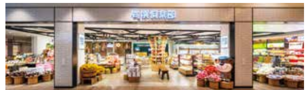
●Pasar連田 NEXCO東日本最大級の施設。キーテナントとして5店舗を運営