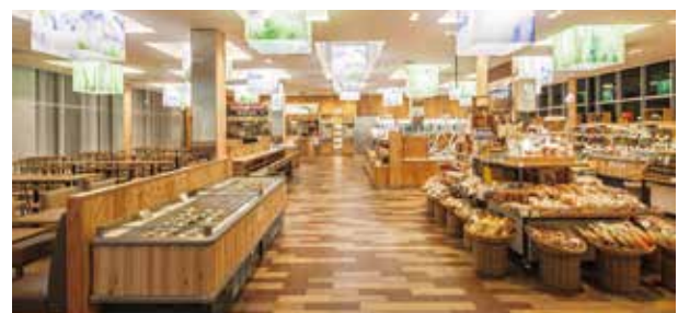
●隈研吾建築都市設計事務所による内装デザイン監修(菖蒲PA)