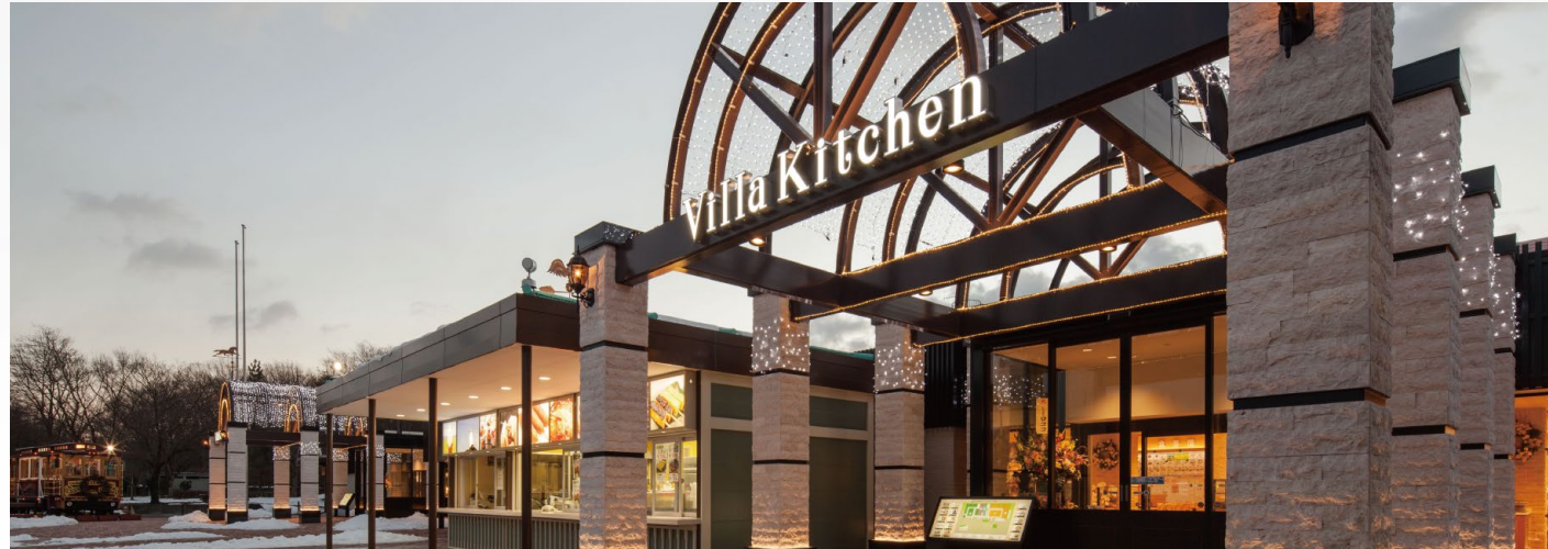
那須高原サービスエリア(東北自動車道上り) 栃木県那須郡那須町豊原丙 4092-2 | 電話: 0287-72-1717

東名高速道路・富士川サービスエリア(下り線・上り線)、東北自動車道・安達太良サービスエリア(上り線)、同・那須高原サービスエリア(上り線)、同・蓮田サービスエリア(上り線)、圏央道・菅蒲パーキングエリア(集約型)の6拠点に於いて、ショッピングコーナー・レストラン・フードコート運営。