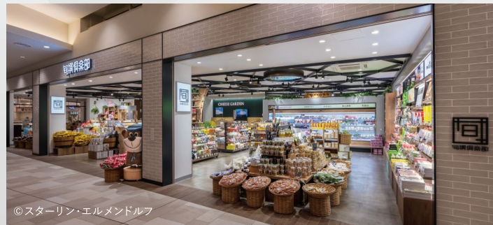
蓮田サービスエリア(東北自動車道上りPasar蓮田) 埼玉県蓮田市川島 370 | 電話: 048-731-8080