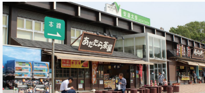
安達太良サービスエリア(東北自動車道上り) 福島県本宮市本宮字天ヶ 221 | 電話: 0243-33-1151