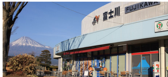
富士川サービスエリア(東名高速道路下り) 静岡県富士市岩淵山 1313 | 電話: 0545-81-0750