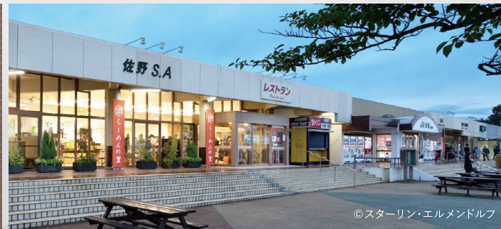
佐野サービスエリア(東北自動車道上り) 栃木県佐野市黒袴町字東山 1010 | 電話: 0283-23-5751