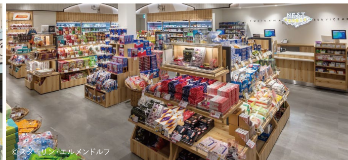
富士川サービスエリア(東名高速道路上り NEST) 静岡県富士市岩淵字北吉野 1500 | 電話: 0545-30-6255